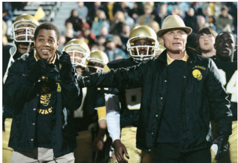
La cinta es protagonizada por Cuba Gooding Jr y Ed Harris (derecha).